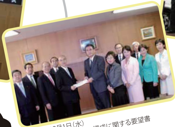
2010年12月1日(水) 平成23年度予算(案)の編成に関する要望書