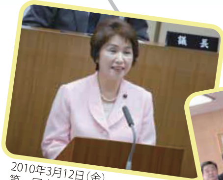
2010年3月12日(金) 第一回定例会での一般質問