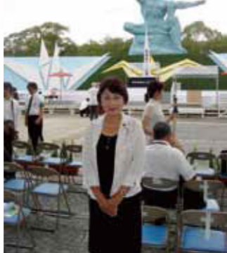
2010年8月9日(月)長崎原爆犠牲者慰霊平和祈念式典に参加