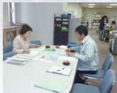
2011年1月12日(水)茨城県日立市と笠間市へ視察