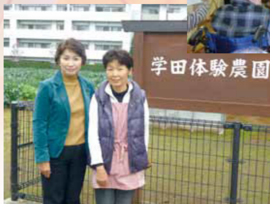
2010年11月22日(月)練馬区の農業を視察