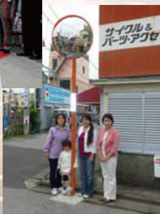
2010年5月7日(金)2つ目のカーブミラー