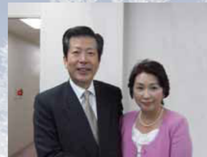
2011年1月5日(水)山口代表と