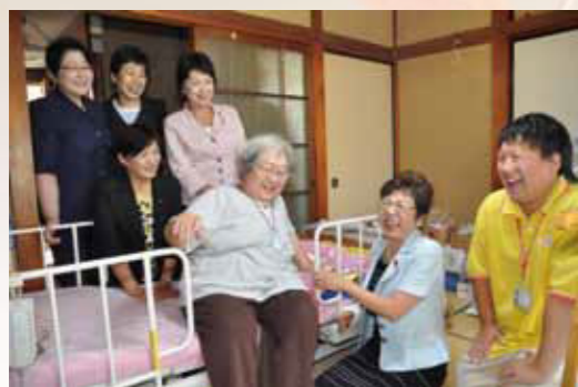
2010年10月15日(金)24時間訪問介護を視察