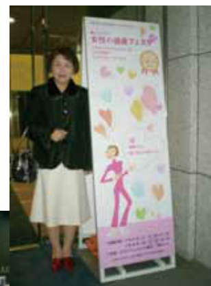
2010年2月27日(土)女性の健康フェスタに参加して