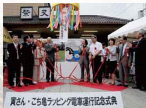
2010年7月5日(月)寅さん・こち亀ラッピング電車運行記念式典に出席