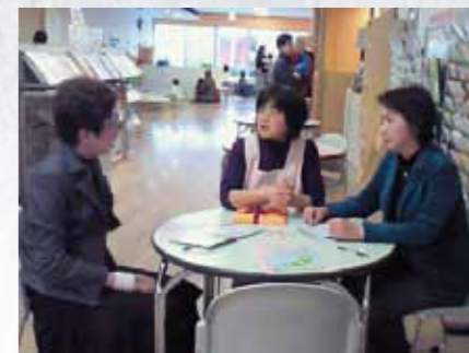
2010年2月7日(日)仙台市子育てふれあいプラザを視察