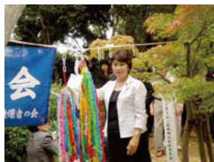
2010年8月9日(月)長崎平和公園献水の儀に参加