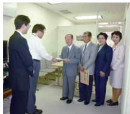
2010年9月24日(金)都庁へ高砂団地の陳情