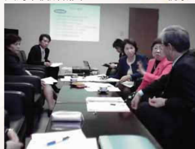
2010年4月16日(金)呉市役所の小中一貫教育を視察