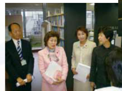
2010年3月25日(木)金町の中央図書館を視察