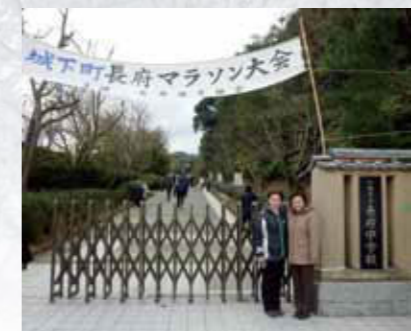
2011年1月16日(水)山口県下関市へ視察