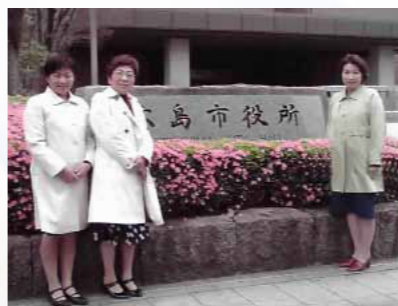
2010年4月16日(金)広島市役所職員のテレワークのを視察