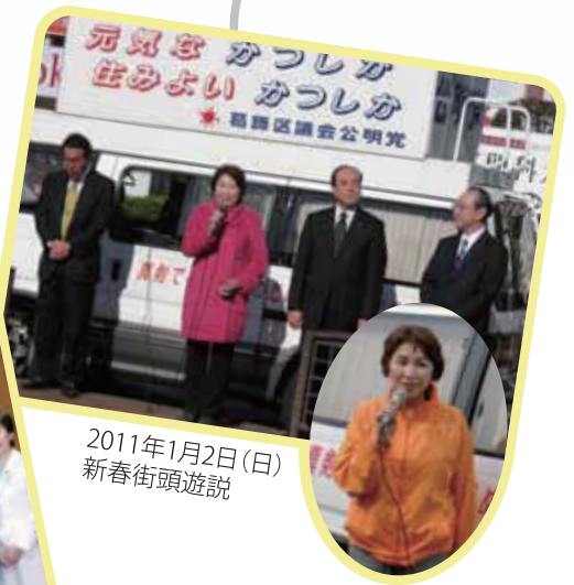
2011年1月2日(日) 新春街頭遊説