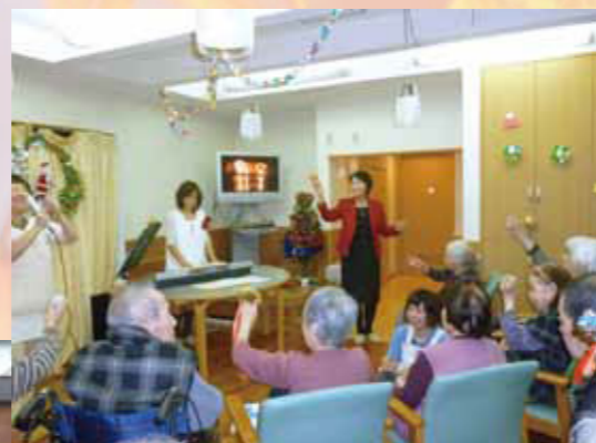
2010年12月17日(金)グループホーム訪問