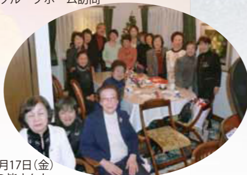
2010年12月17日(金)薔薇の会の皆さんと