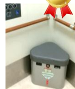
総合庁舎のエレベーター内

災害時に、エレベーター内に閉じ込められた時に、必要な非常用品を収納しています。(平成26年 第3回定例会)