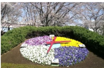
葛飾区小菅西公園

問：花いっぱいの公園のシンボルとして、改修される鎌倉公園に大きな花時計を設置し、冬場には、公園全体をイルミネーションスポットとすることも魅力的な方法の一つだと思う。また、公園を訪れた方々の滞在時間を増やす工夫として、地域との協働で移動販売車などによる飲食の提供をしてはどうか。